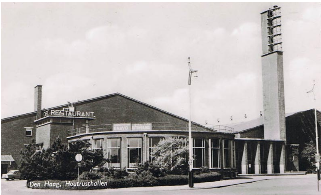
De Haagse Houtrushallen, al lang geleden gesloopt. In de beginjaren '60 was de HOKIJ, de Haagse ijs(hockey)baan gevestigd in het gebouw achteraan. Het was de eerste overdekte kunstijsbaan in Nederland. Vooraan de Houtrustronade, waar 't hier om gaat.